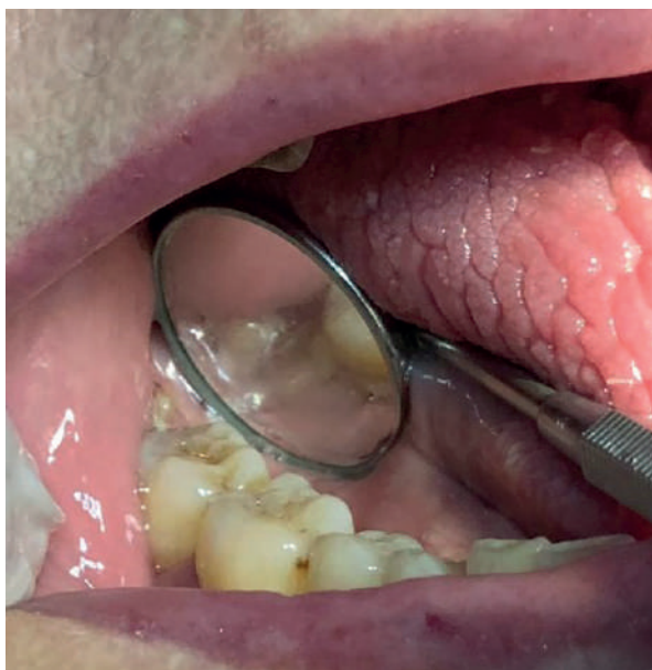
Figura 4. Presencia de resto radicular de pieza 48.

lio paraqueratósico y acantopapilomatósico, observándose en el corion subyacente un proceso inflamatorio fibroangiohiperplásico con denso infiltrado inflamatorio crónico activo con polimorfos nucleares neutrófilos y eosinófilos. El informe anatomopatológico describió úlcera crónica inflamatoria sin signos de especificidad. A la muestra se le realizaron técnicas de inmunohistoquímica con el anticuerpo AE1/AE3 para descartar infiltración neoplásica en relación con la úlcera. Estas pruebas resultaron negativas, y así se descartó la infiltración de células epiteliales en el tejido conectivo.