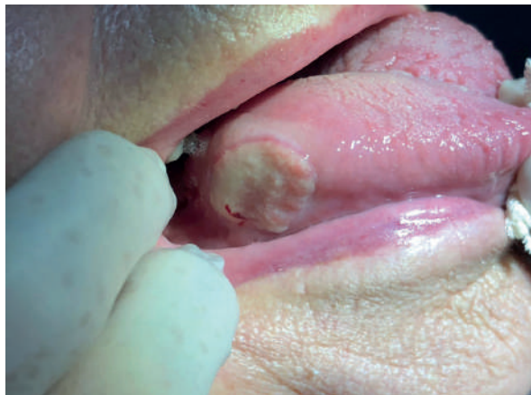
Figura 1. Úlcera infiltrada en borde lateral derecho, tercio posterior.

La paciente fue informada de la necesidad de eliminar el trauma por medio de la exodoncia de la pieza 48. Sin embargo, por el estado de ansiedad producto del diagnóstico presuntivo (cáncer), en esa primera sesión se decidió realizar una biopsia inci-