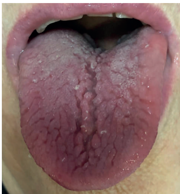
Figura 2. Vista de la lengua en propulsión en la que se observan asimetría (aumento de volumen en lado derecho) y múltiples pliegues característicos de la lengua cerebriforme o plegada.

sional o parcial de la lesión, previamente a lo cual la paciente firmó el consentimiento informado. La muestra fue remitida al laboratorio de la cátedra de Anatomía Patológica de la Facultad de Odontología de la Universidad de Buenos Aires.