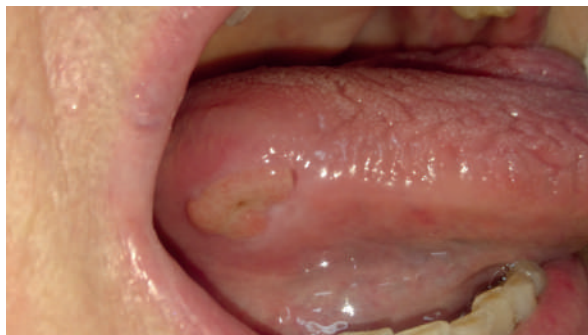
Figura 5. Control clínico a 7 días de la exodoncia.

En las figuras 7 a 9 se muestran los aspectos clínicos de los controles: la lesión fue perdiendo relieve