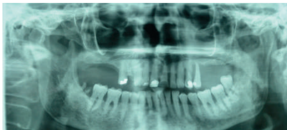
Figura 3. Radiografía panorámica en la que se evidencia imagen radiopaca compatible con resto radicular en área de 48.